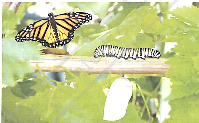
耶穌真的可以使人有一百八十度的改變