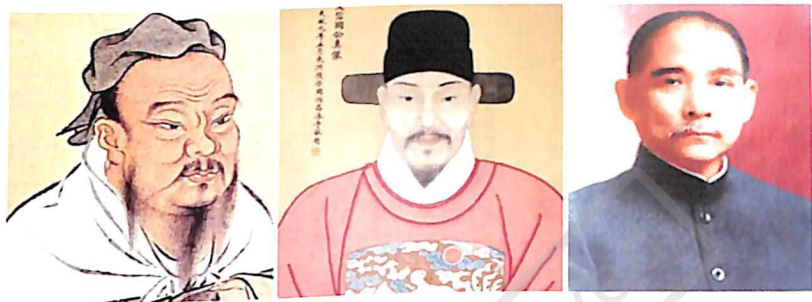
中國歷史中，偉大的人物多的是（左起：孔子、文天祥、孫中山）