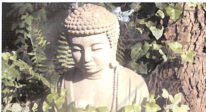
釋迦牟尼在世已得權貴支持，備受尊崇

我們再看伊斯蘭教的穆罕默德。雖然他起初十年在麥加 (Mecca) 傳教的時候，也受到反對與迫害，但當他遷移根據地到麥地那城 (Medina) 時，已經帶着超過三百名信眾。在麥地那六年以後，他完全掌控整座城的政治權力，成為他們的領袖。經過三次決定性的大戰役，穆罕默德帶着一百萬大軍進逼麥加城，結果是全城的投降歸順，他亦成為麥加城的政治、軍事和宗教的至高領袖。穆罕默德自四十歲開始傳教後，有二十二年傳教和建立政權的年月。在他逝世時，已經建立了伊斯蘭帝國的政權。 2 他能建立龐大的宗教、擁有政治影響力，都是可以理解的。